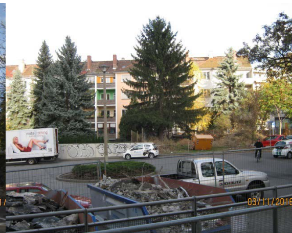
Innenhof Postelwitzer Straße