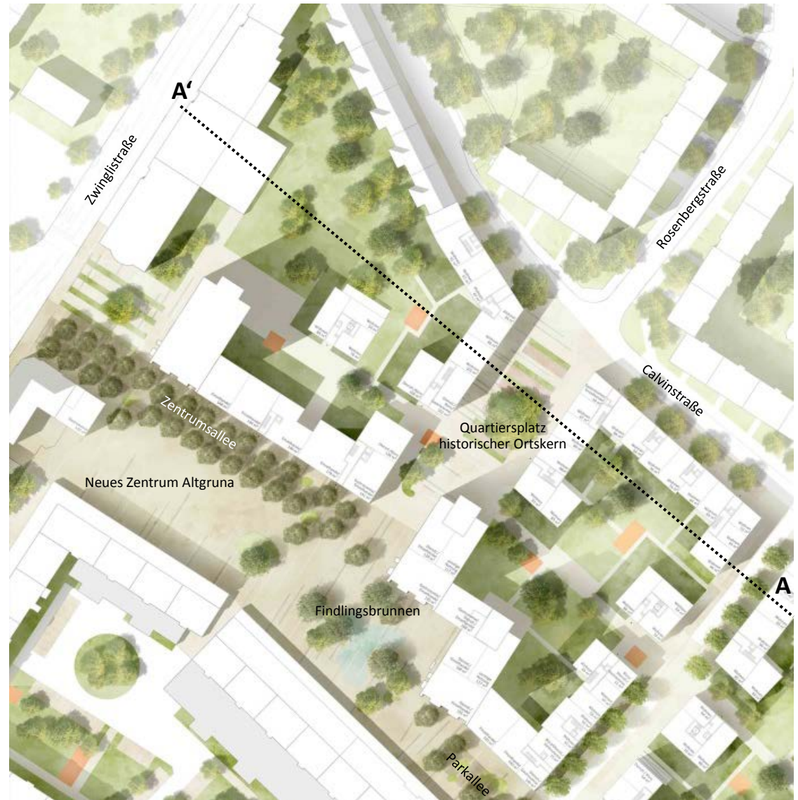
Detail Höfe und Marktplatz