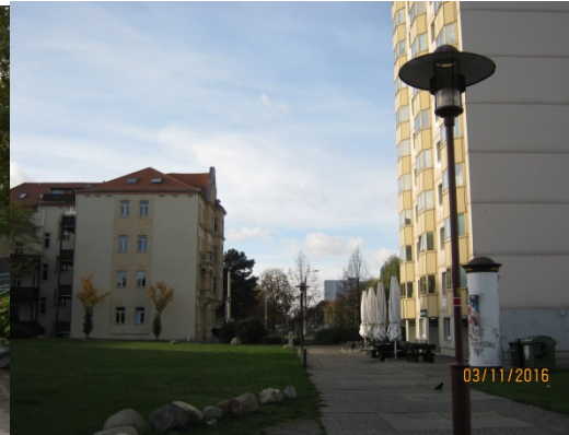
Blick Richtung Stübelallee