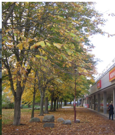
Ladenzeile Papsdorfer Straße