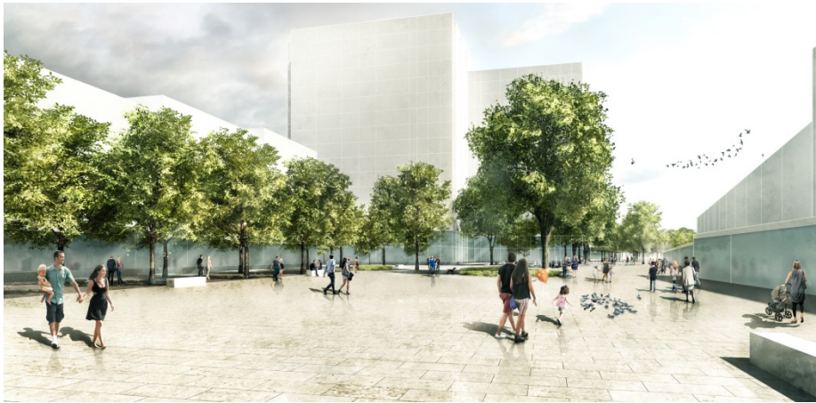
Perspektive neues Zentrum Altgruna