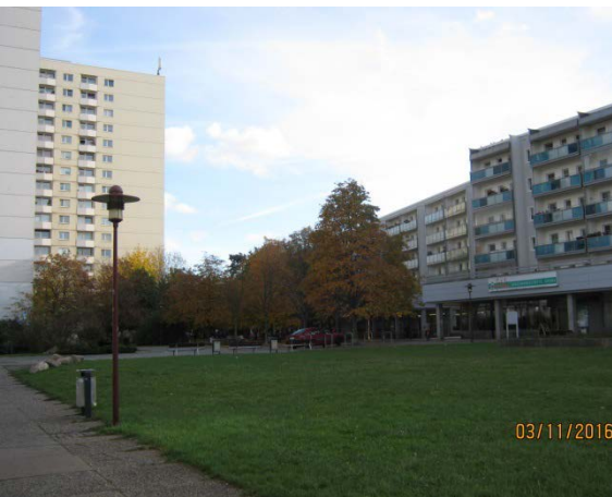
Blick auf die Ladenzeile